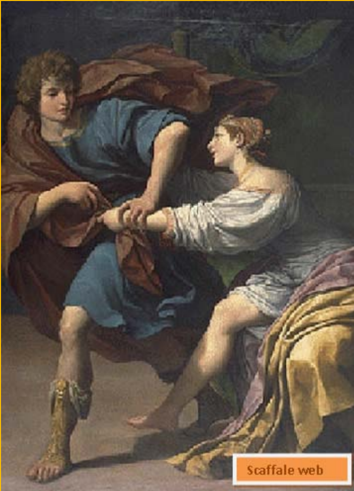
14 - Lionello Spada, Giuseppe e la moglie di Potifar, 1620