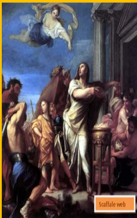
9 - Carlo Maratta, l'imperatore Augusto chiuso le porte del tempio di Giano o di Pace di Augusto, 1660