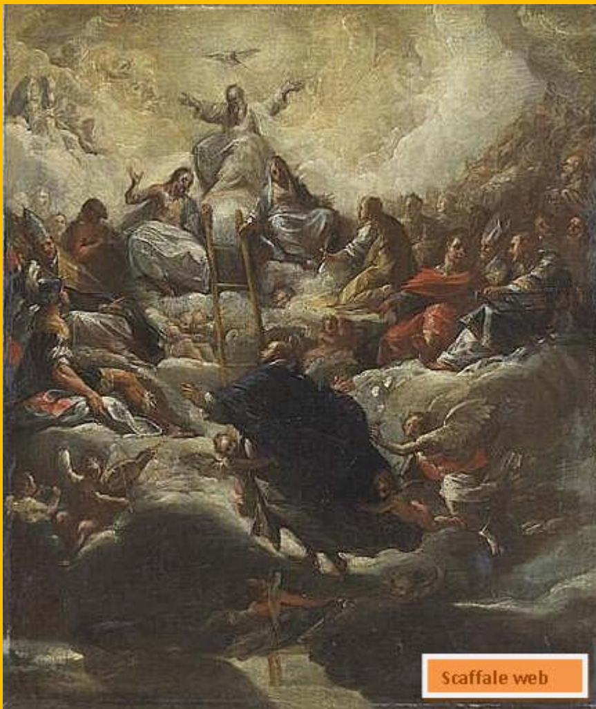
1 - Assereto Giovacchino, Apotheosi di San Tommaso d'Aquino, tra il 1626 e il 1636. (Genova 1600 - Genova 1649)