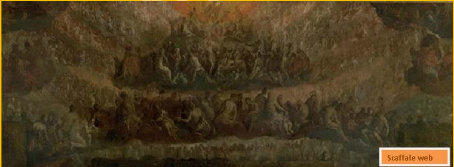
22 - Paolo Caliari, detto VERONESE Bozzetto per il Paradiso, a circa 1578