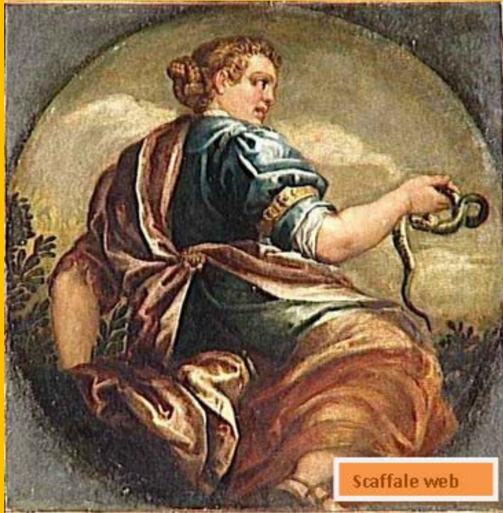
11 - Francesco Montemezzano, (La Eloquenza) Retorica (1540-dopo 1602)