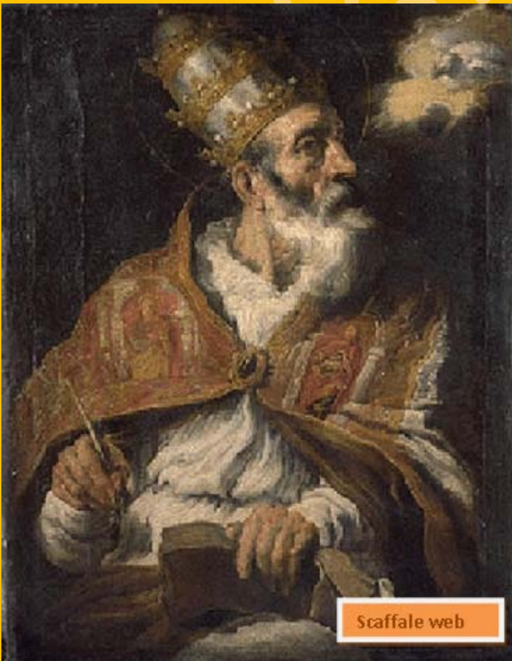
4 -Domenico Fetti, San Gregorio Magno, il primo quarto del XVII secolo