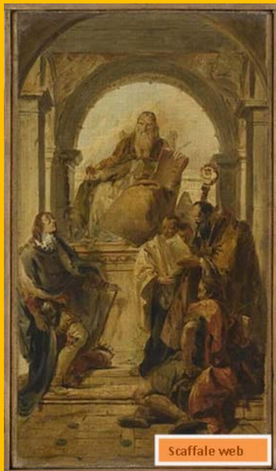
18 - Giovanni Battista Tiepolo (dopo), Sant'Agostino, San Luigi dei Francesi, San Giovanni Evangelista e un Santo Vescovo