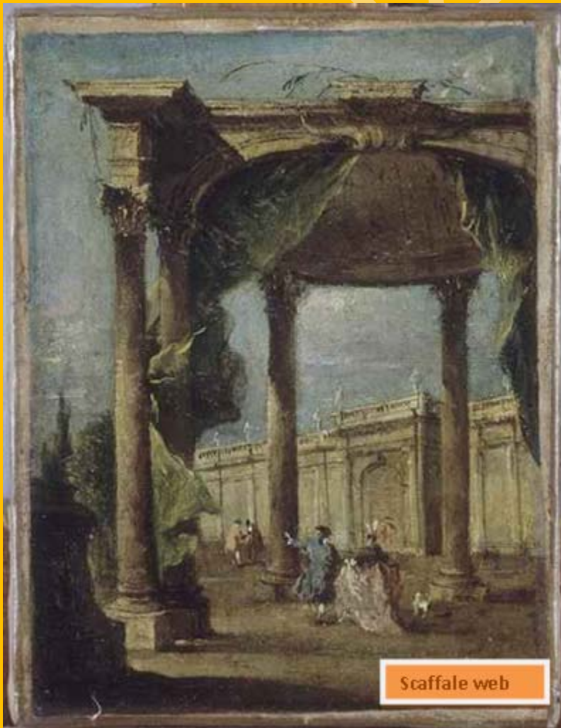
7 - Francesco Guardi, Un capriccio architettonico metà del XVIII