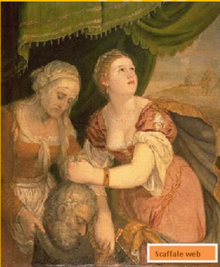
15 - Lambert Sustris, Giuditta che detiene la testa di Oloferne, tra il 1548 e il 1551