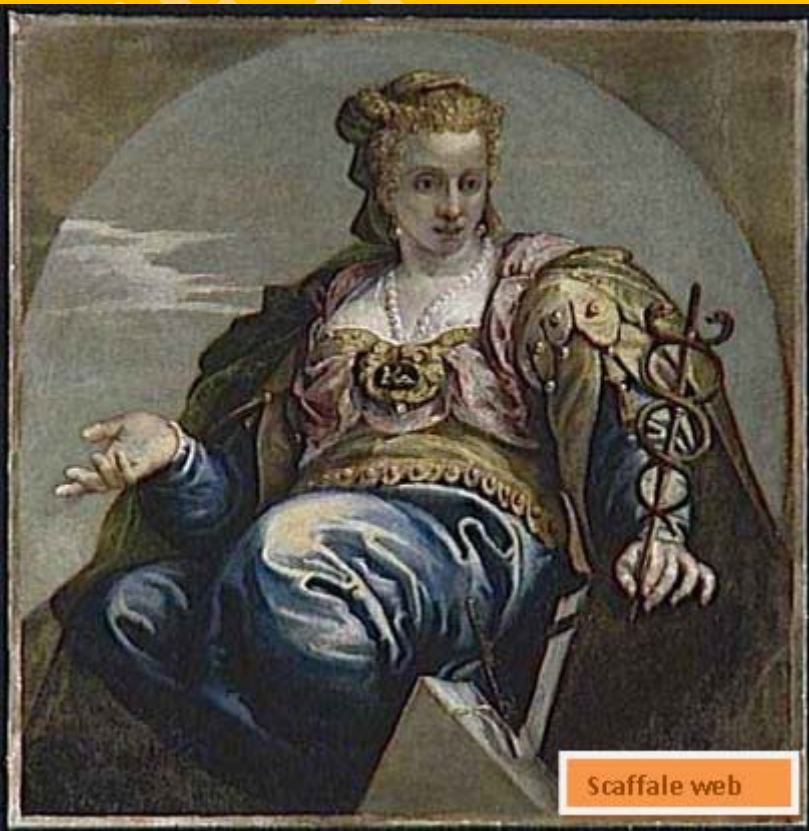
13 - Francesco Montemezzano, (La Scienza) Astronomia (1540-dopo 1602)