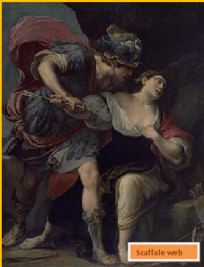
17 - Alessandro Tiarini, Rinaldo e Armida, 1620